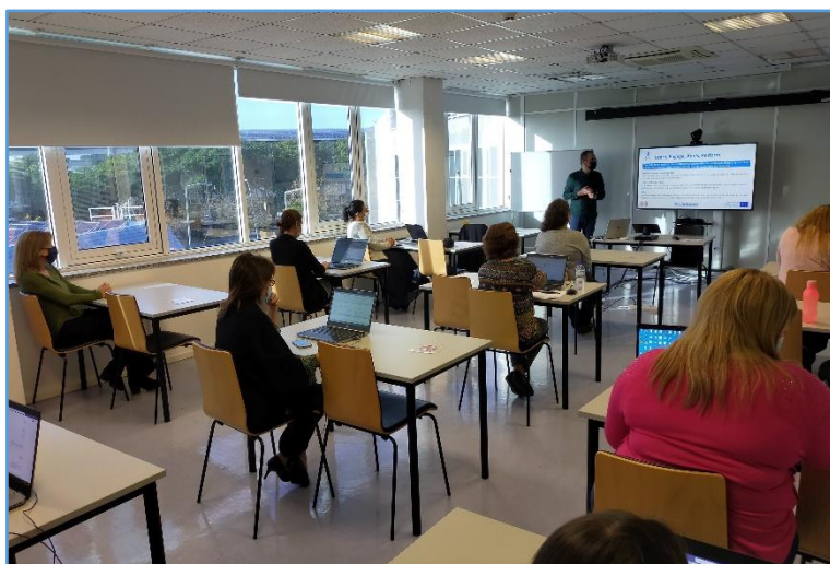
Evento de disseminação em Portugal

Em Portugal, foram realizados dois eventos de disseminação, nas instalações da ISQ Academy.